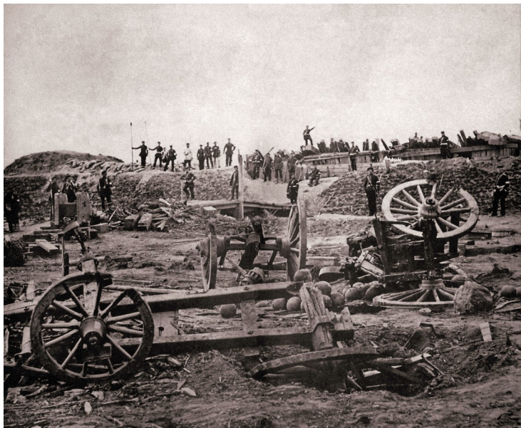
De sønderskudte skanser ved Dybbøl efter stormen 18. april 1864.