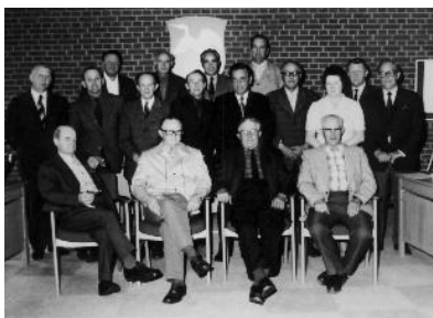
Den sparsommelige kommunalbestyrelsen i Vinderup 1970 –1974.