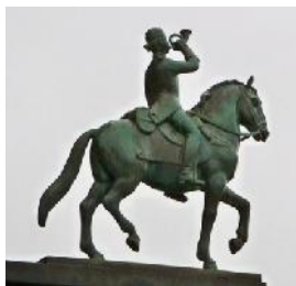
En postrytter udenfor Skanderborg Posthus