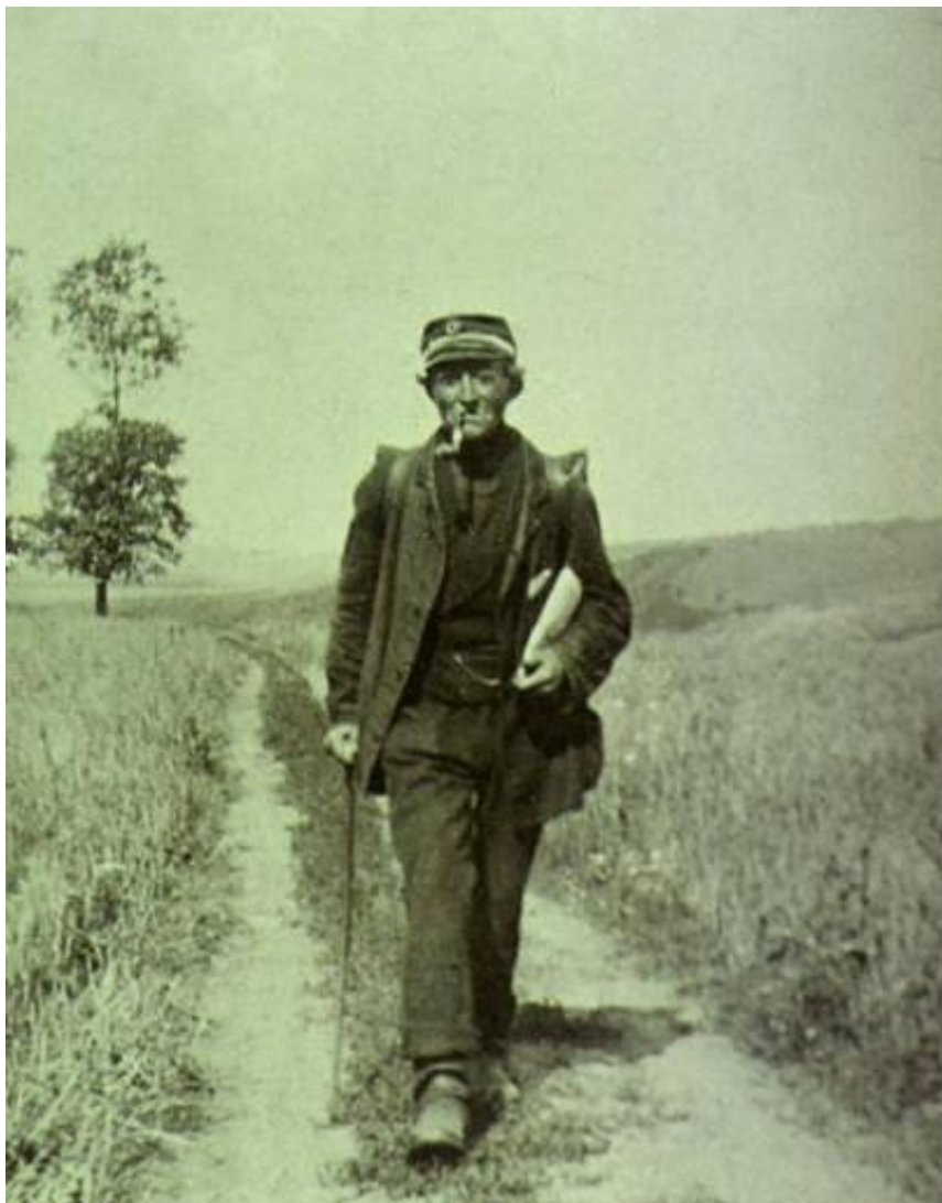
Landpost på sin rute for omkring 100 år siden.

Landposten blev oprettet i 1860, altså lang tid efter de omtalte postryttere. Fra 1894 fik landpostbude tilladelse til at anvende cykel i tjenesten, hvis de vel at mærke anskaffede den for egen regning. Omkring 1894 svarede prisen på en cykel til otte måneders løn for et landpostbud, der tjente 20 øre i timen. Alligevel anskaffede mange bude en cykel selv, idet de ofte havde budjobbet som supplement til deres indtægt som husmænd eller håndværkere. Med cyklen kunne de komme hurtigere gennem ruten og videre til dagens øvrige opgaver.