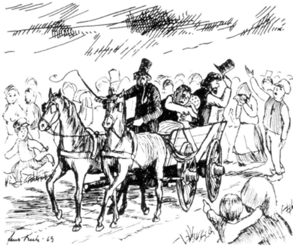
Således forestillede Skalks tegner sig i 1965, at udfarten fra Skælskør tog sig ud.

Stof til denne artikel er hentet fra en bog af V. Møller: "Fra svundne Dage" I , udk. 1930, samt fra tidsskriftet "Skalk" 1965-4 og 1990-1.