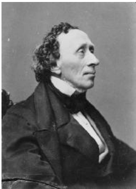
H.C. Andersen, født 2. 4. 1805, død 4. 8. 1875.

For kæresteparret blev det en kort lykke og medhjælperen måtte dele skæbne med de to. H.C. Andersen fortæller: "Just da vi kom til byens port gik denne op, og hele optøget kom frem. Pigen var meget smuk, men dødbleg. Med et forunderlig blik stirrede hun på mængden og på egnen rundt om. Hun lå i karestens arme, han var rød og rund at se til, mens den anden, karlen der havde hjulpet dem med at aflive faderen, var gulbleg med lange sorte hårtjavser, der hang ham ned over ansigtet. Nogle tjenestekarle der var mødt op for at se forestillingen, råbte "Levvel" til ham, han tog hatten af og nikkede.